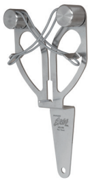
Utilisation manuelle, droitier ou gaucher

Ne requière aucune formation particulière, l'ERGO STEEL Inoxydable peut être utilisé confortablement et en toute sécurité par les droitiers ou les gauchers.