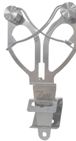
Installé sur un support fixé à la hauteur de la table de travail