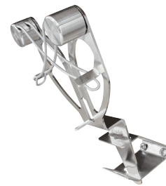
Installé sur un support fixé en position élevée