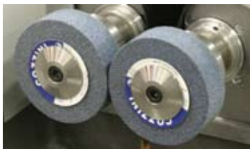
Pietre di molatura HG4S

COZZINI PRIMEEdge CUTTING EDGES AND SHARPENING SOLUTIONS