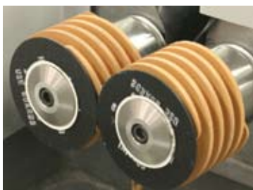
Pietre di affilatura HE4