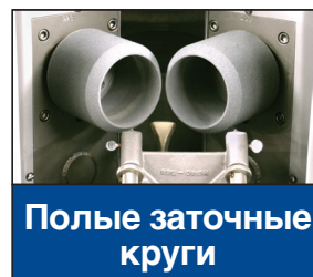
Полюе заточные круги

PRIMEEdge ® COZZINI CUTTING EDGES AND SHARPENING SOLUTIONS