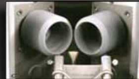
Hollow grinding wheels