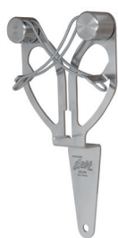
Można trzymać ją w ręku, prawo- lub leworęcznie

Stal nierdzewna jest odporna na korozję i rdzewienie. Odpowiednie procedury mycia i sterylizacji muszą być przestrzegane, aby zapewnić integralność stalowej Ergo Steel. Wybór metody i częstotliwości mycia zależy od specyfiki linii przetwórczej, produktu, który jest przetwarzany, ilości osadu, który zbiera się na stalce podczas pracy oraz wymogów higienicznych w danym zakładzie. Chemiczne środki do dezynfekcji są często bardziej żrące niż środki myjące, stąd zalecamy używanie ich z rozważą. Ze względu na dużą różnorodność dostępnych chemicznych środków do dezynfekcji, zdecydowanie zalecamy przeprowadzenie małej próby oddziaływania danego środka w normalnym stężeniu na stal nierdzewną przed przystąpieniem do czyszczenia nim stalowej Ergo Steel.