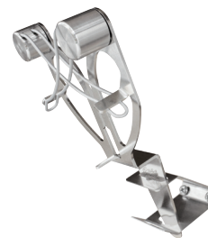
Można wsunąć pod kątem do uchwytu powyżej blatu roboczego