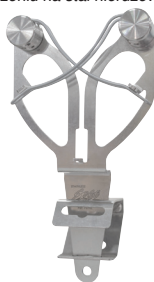
Można wsunąć pionowo do uchwytu na wysokości blatu roboczego