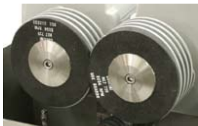
Pietre di molatura

COZZINI PRIME Edge CUTTING EDGES AND SHARPENING SOLUTIONS