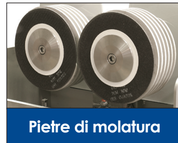
Pietre di molatura

PRIME Edge® COZZINI CUTTING EDGES AND SHARPENING SOLUTIONS