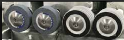
Шлифовальные круги Хонинговальные круги