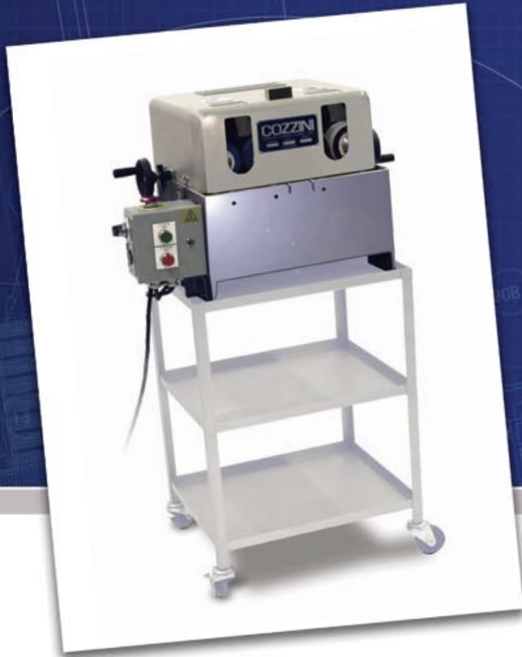
Ilustração com carrinho opcional.