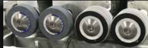
Pedras para desbaste