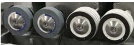
Pedras para desbaste

COZZINI PRIMEEdge CUTTING EDGES AND SHARPENING SOLUTIONS