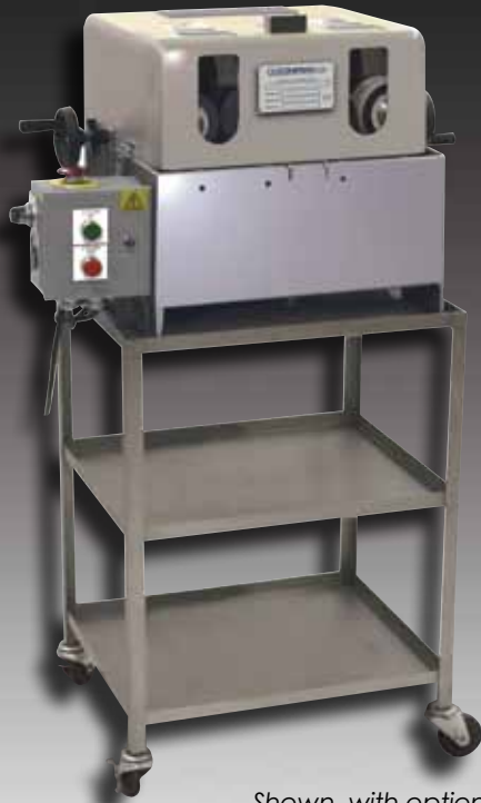
Shown with optional cart