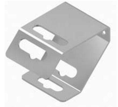
Suporte de fixação HES-3B Vendido separadamente

ERGO ® STEEL III COZZINI EDGE MAINTENANCE TOOL