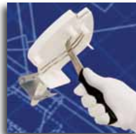
Suporte instalado para uso em alturas mais elevadas