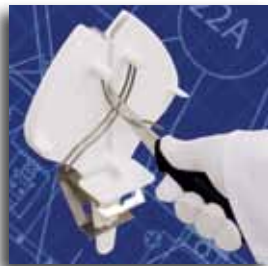
Suporte instalado para uso na altura da mesa de trabalho