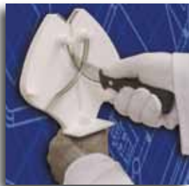
Uso através de suporte ou manual

Não requer treinamento para utilização. O Ergo Steel III pode ser manipulado com segurança por destros e canhotos. O Ergo Steel III pode ser montado no suporte de fixação em aço inoxidável ou manualmente com o operador.