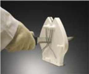
Montado en mesa

COZZINI PRIMEEdge CUTTING EDGES AND SHARPENING SOLUTIONS