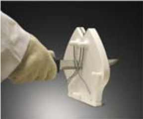
Montato su banco

COZZINI PRIMEEdge CUTTING EDGES AND SHARPENING SOLUTIONS