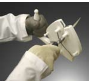
Option à la main