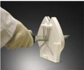
Monté sur un établi

COZZINI PRIMEEdge CUTTING EDGES AND SHARPENING SOLUTIONS